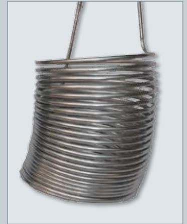
Serpentín de refrigeración en acero inoxidable